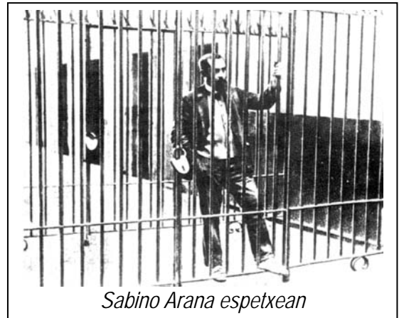
Sabino Arana espetxean

Urte bat geroago, 1895ean alegia, sortu zen Euzko Alderdi Jeltzaleak bere egin zuen ikurrina. Era horretara, Bizkaia irudikatzeke jaio bazen ere, laster alboratu zuten hasierako esanahi mugatu hura eta Euskal Herri osoaren ikurtzat hartzen hasi zen ikurrina. Euskaldunon bandera bihurtu zen berehala.