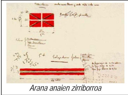
Arana anaien zirriborroa

Ikurrinak, Euskal Herriko bandera eta ikur nagusi bihurtu denak, 115 urte betetzen ditu aurtengo 2009an. Luis Arana Goirik, Sabinoren anaiak, marraztu zuen 1894an Bizkaiko bandera gisa. Bai, amesten zuten Bizkaia burujabearen ikur izateko sortu zuten ikurrina Arana Goiri anaiek, nazio modernoaren banderak eredu hartuz. Izan ere, ezaguna da Sabino Aranak Ingalaterrarekiko zuen miwesmena eta, hainbat adituek diotenez, Erresuma Batuko banderaren itxura orokorra eman nahi izan zion.